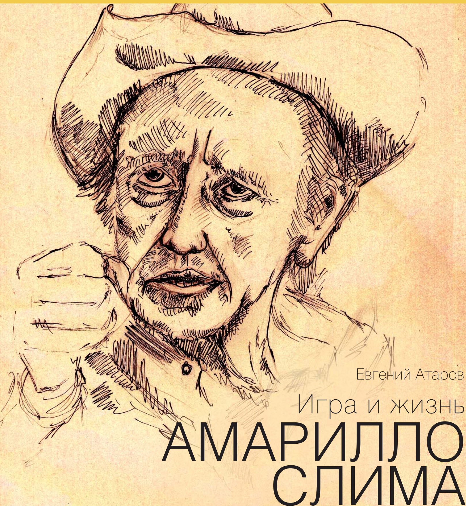
Иллюстрации Евгении Богдановой